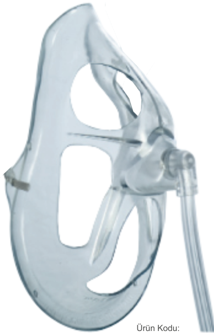
Ürün Kodu: OM-1125-8 OxyMask